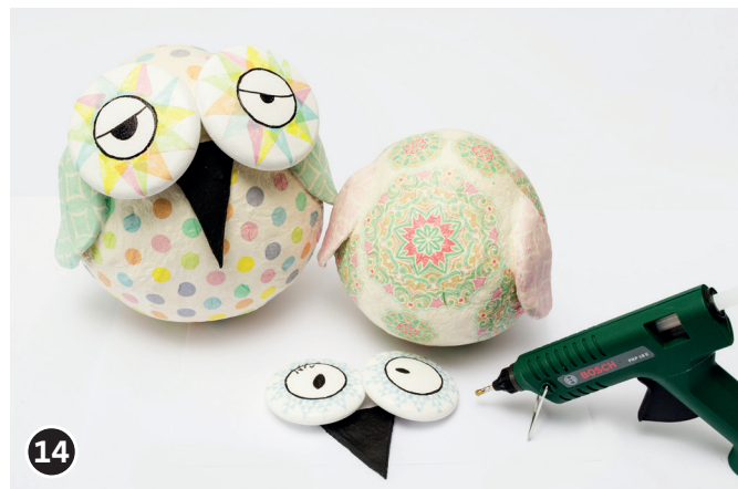
14 Schnabel und Augen mit Heißklebepistole fixieren.

Viel Spaß bei der Umsetzung wünscht Ihnen Ihr OPITEC-Kreativteam!