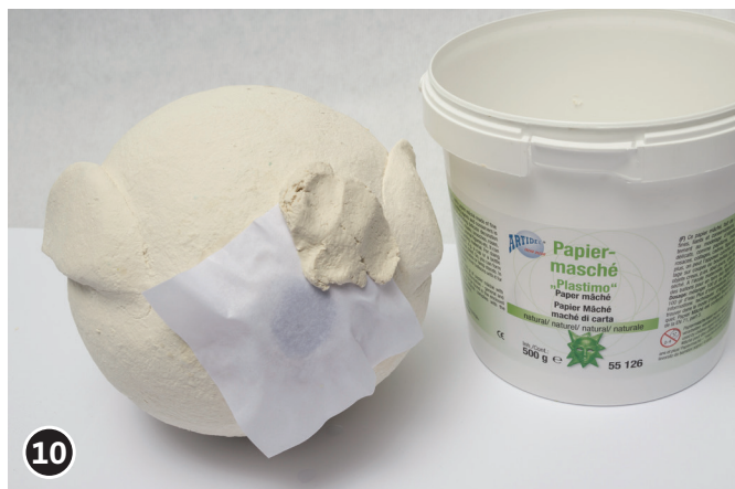
10 Öffnung mit Pappmaché verschließen, Papiermaché trocknen lassen.