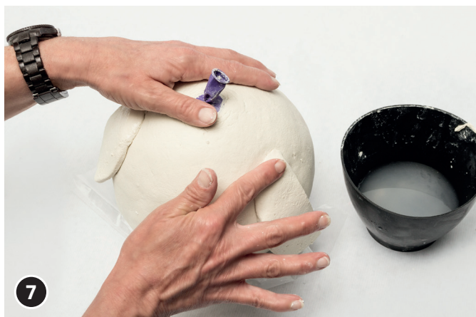
7 Flügel mit Wasser am Eulen-Körper andrücken. Pappmachè-Körper ca. 3 – 4 Tage trocknen lassen.