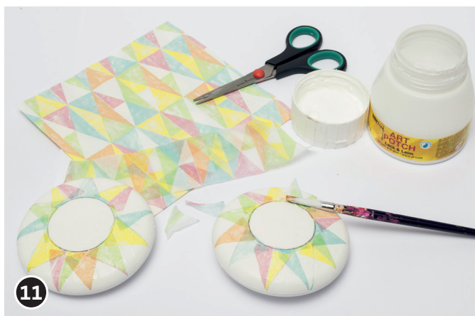
11 Serviette in gewünschte Form schneiden. Die oberste Schicht der Serviette abnehmen, diese mit Serviettenkleber auf den Medaillons fixieren. D. h. Serviette mit der Unterseite auflegen, den Serviettenkleber auf die Oberseite der Serviette streichen. Der Klebstoff trocknet transparent auf.