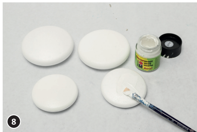
8 Styropor-Medaillons mit weißer Farbe grundieren.