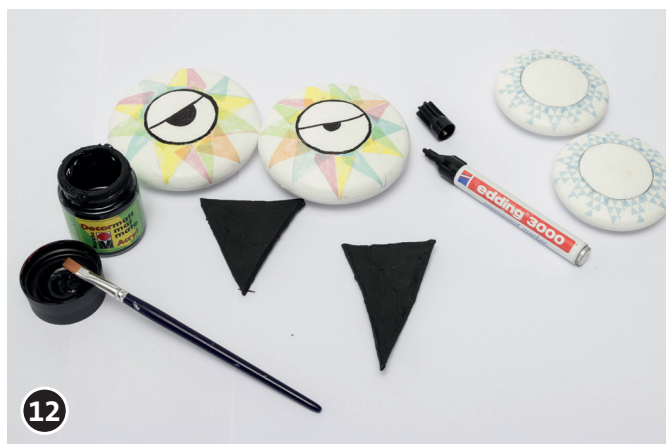
12 Augen mit dem edding-Stift aufmalen. Schnabel mit schwarzer Farbe grundieren. Farbauftrag trocknen lassen.