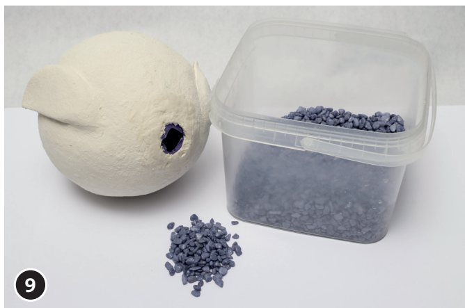
9 Getrockneten Eulen-Körper mit Steinchen füllen.