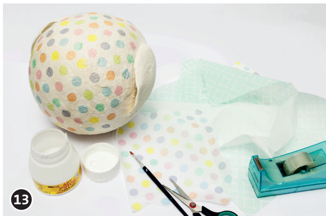
13 Eulen-Körper und Flügel, wie beschrieben, mit Serviette bekleben. Klebeschicht trocknen lassen.