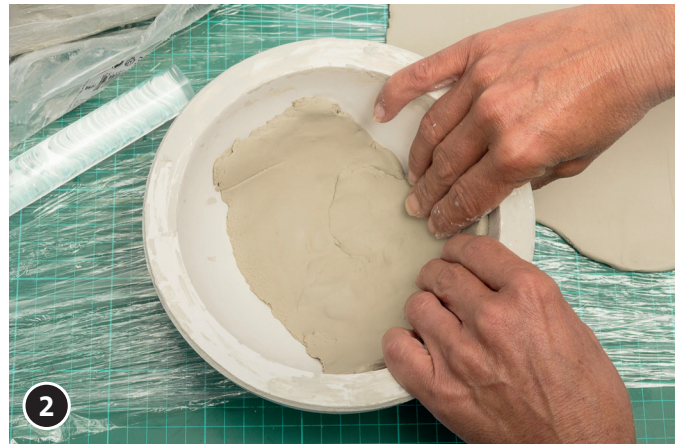
2 Ein handliches Stück abtrennen und in das Innere der Gipsform-Halbkugel drücken. Ein weiteres Stück in der Kugelhälfte anlegen und andrücken. Das Innere der Kugelhälfte komplett belegen.