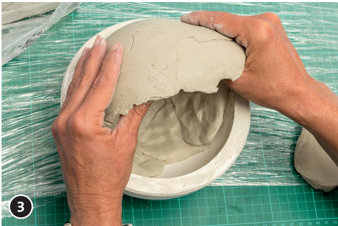
3 Nun einen Teil der Ton-Halbkugel nach oben (außen) schieben bis sich ein freier Platz im Kugel-Inneren ergibt.