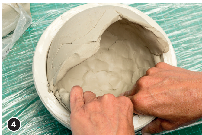
4 Diesen Vorgang mehrmals wiederholen.