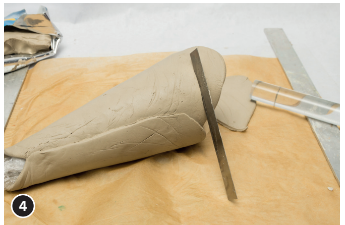
4 Die Soft-Ton Platte um den Kegel legen. Den Soft-Ton bündig am Kegel-Boden abschneiden. Kanten mit Wasser glätten.