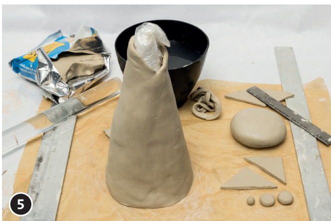
5 Medaillon (Kopf), Ohren, Augen und Nase, passend zur Größe des Kegels, aus Ton modellieren.