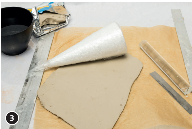
3 Den passenden Styropor-Kegel mit einer Frischhaltefolie umwickeln.