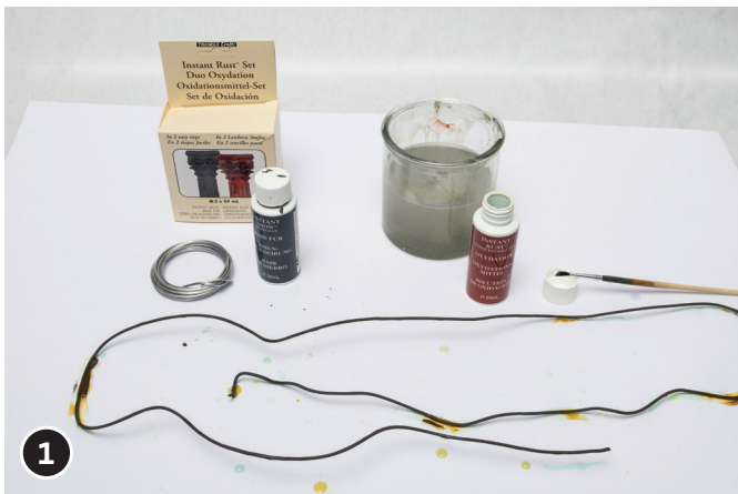
1 Rost-Effekt nach Produktanleitung anwenden. Aludraht mit Rost-Effekt einstreichen.