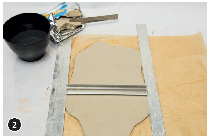
2 Eine ca. 5 mm starke Platte aus Soft-Ton ausrollen.