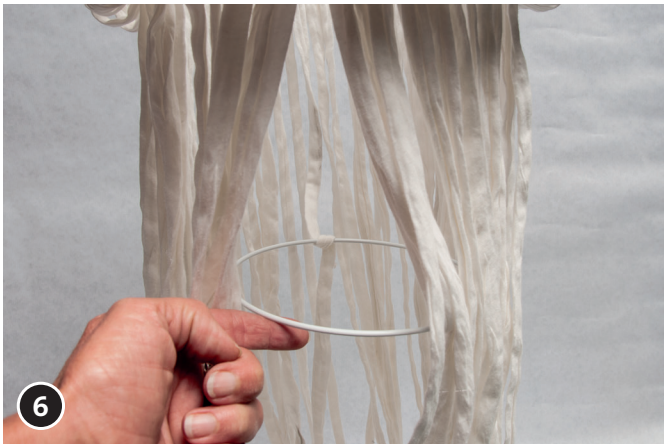
6 Den \varnothing 150 mm Drahring zur Hand nehmen. In gewünschtem Abstand ein Band aufnehmen, dieses von außen nach innen um den Reif schlingen.