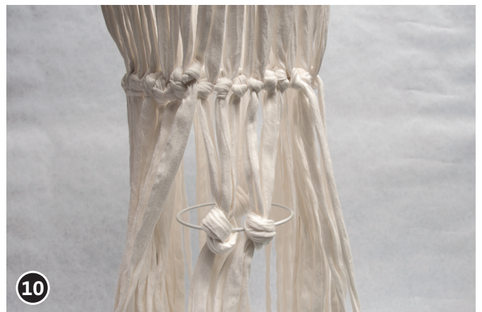
10 Mit gewünschtem Abstand in jedes Band einen Knoten knüpfen. Den letzten ca. \varnothing 100 mm Drahring, wiederum mit Abstand zum vorigen Ring, mit Band umschlingen, dieses Mal verknoten. Alle Bänder an den kleinsten Ring knoten.