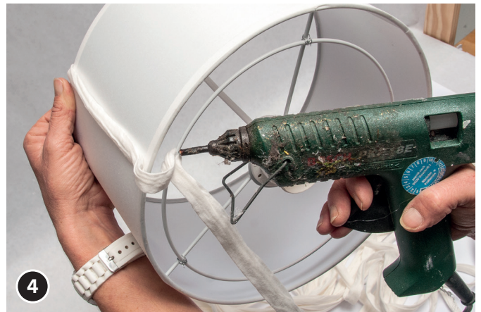
4. Das lose Band-Ende, mit etwas Zugabe, oben über den Metallring führen und fixieren.