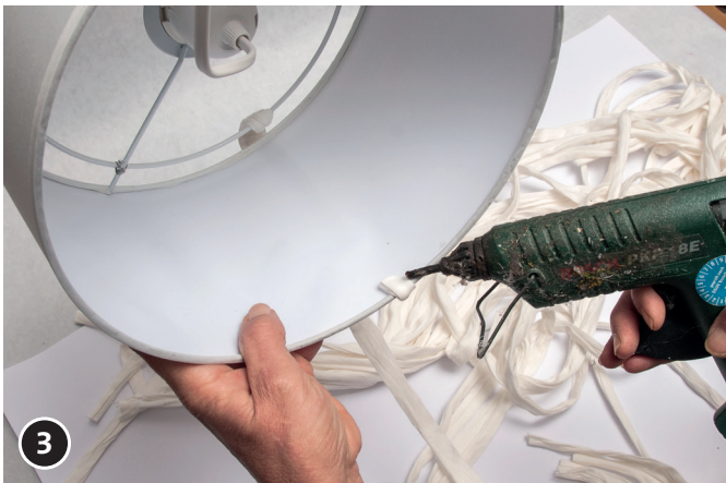
3 Ein Band-Ende an der inneren Oberkante des Lampenschirms befestigen.