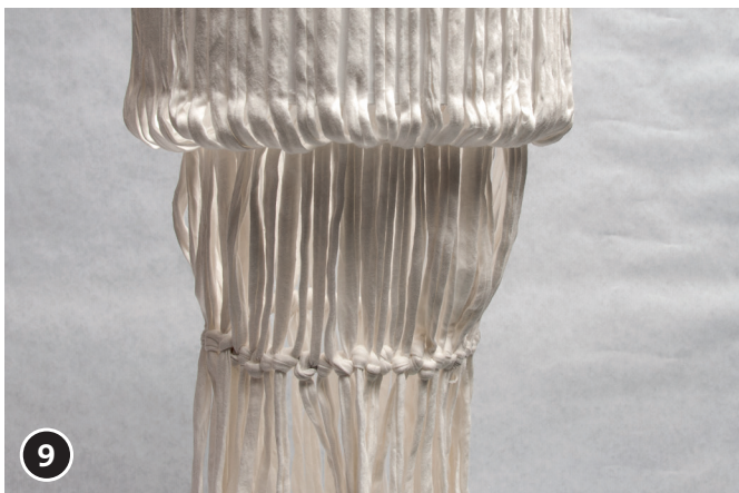
9 Alle Fäden wie beschrieben anbringen.