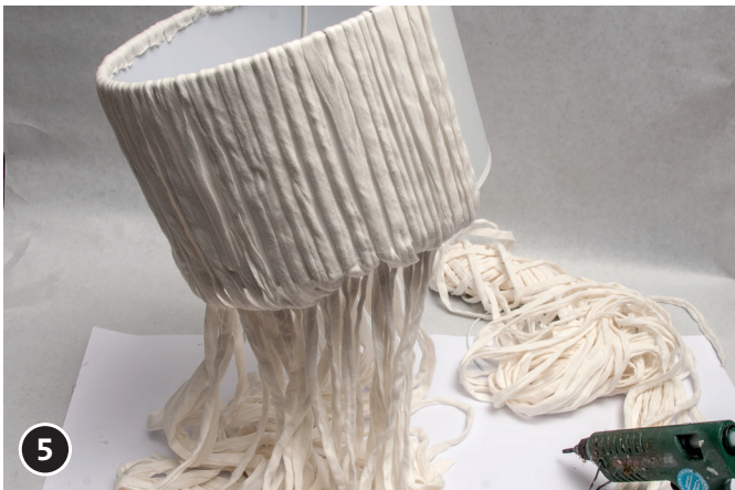
5 Den kompletten Lampenschirm wie beschrieben mit Band bekleben. Wenn möglich zur leichteren Handhabung den Schirm aufhängen.