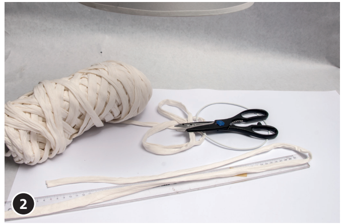
2 Vom Hoooked Zpagetti-Knäuel ca. 120 cm lange Schnüre abtrennen (ca. 90 – 100 Stück).