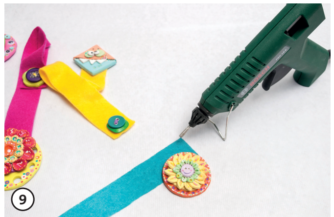
Das Soft-Ton Modell an das andere Ende des Filzstreifens kleben (Heißklebepistole).