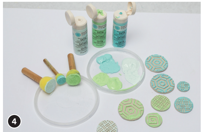
4 Mit den Schablonen-Zwergen die getrockneten, runden Motive colorieren.