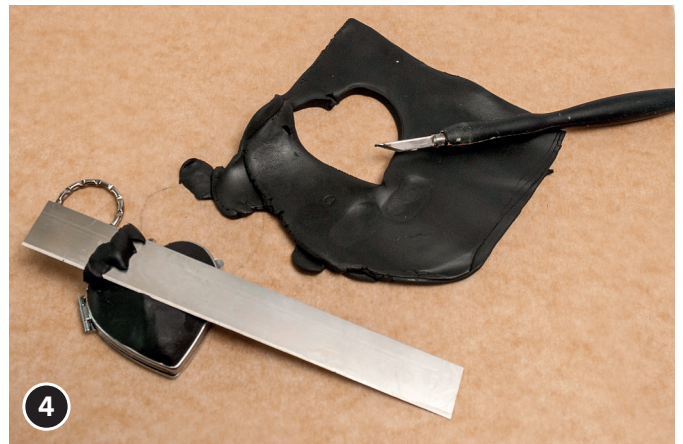
4 Modelliertes Herz auf die vertiefte Oberfläche des Herz-Spiegels legen. Modelliermasse andrücken, überstehende Masse (am Rand) mit dem Fimo-Cutter abschneiden.