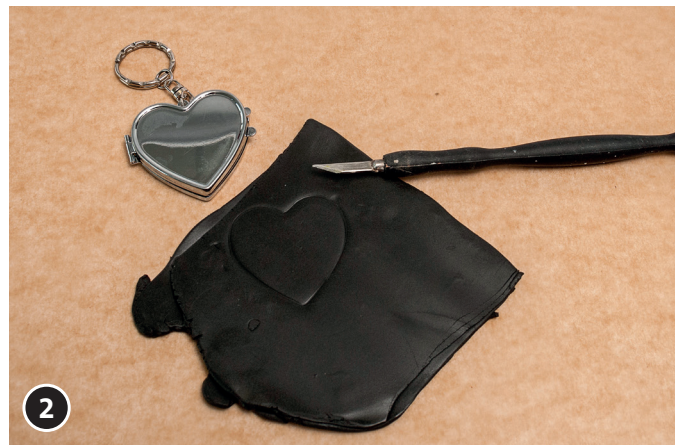
2 Herz-Spiegel auf die Modelliermasse auflegen. Kontur mit dem Bastelmesser nachschneiden.