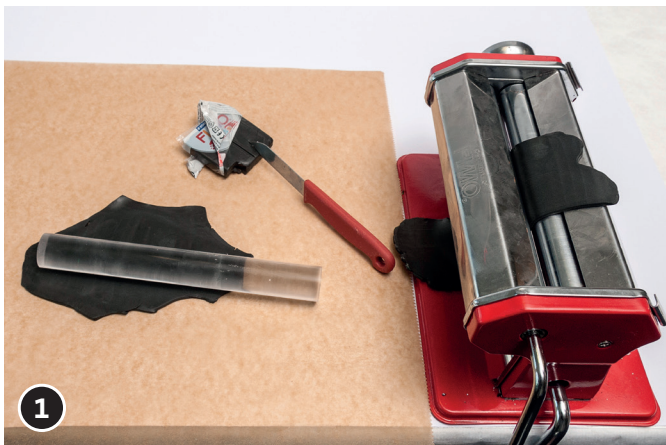
1 Modelliermasse mit den Händen warm kneten. Eine ca. 2 – 3 mm starke Platte mit dem Modellier-Roller (oder der Knetmaschine) ausrollen.