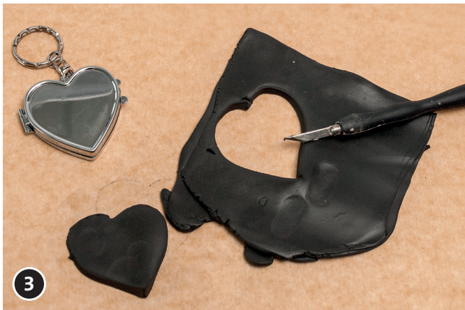
3 Modelliermassen-Herz aus der Masse trennen.