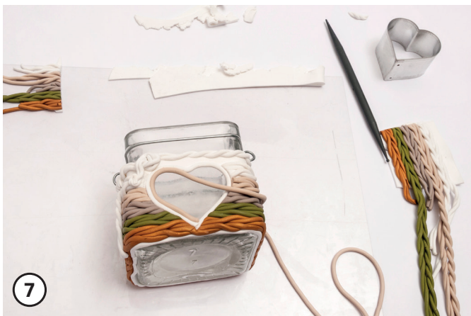
7 Motiv-Kante mit einer Fimo-Schnur abdecken.