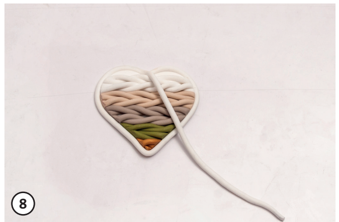
8 Um das ausgestochene (Fimo)Strickherz ebenso eine Schnur legen und andrücken. Zum Aufhängen ein Loch in das Modell bohren (Holzstäbchen). Alle Fimo-Modelle auf ein Backblech mit Backpapier legen. Modelle bei 110° C, ca. 30 Minuten im Backofen härten. Aus dem Backofen nehmen, an der Luft abkühlen lassen. Der (Fimo)Strick- Anhänger kann mit einem Dekoband an das Glas oder an einen Zweig gehangen werden.