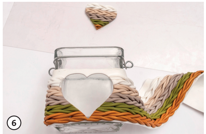
6 (Fimo)Strickband auf dem Glas anlegen und anpassen.