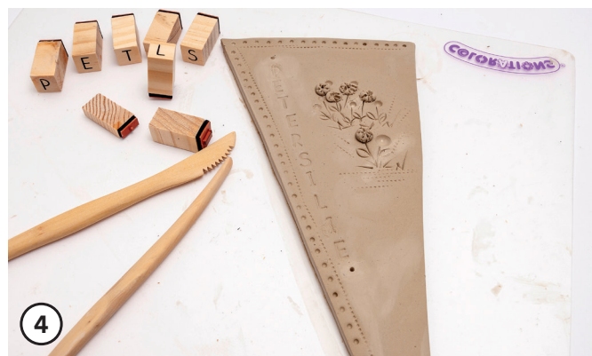
4 Gewünschten Begriff mit dem Stempel eindrücken. Mit Modellier-Hölzern Verzierungen modellieren und prägen.