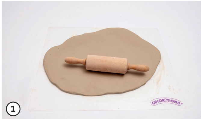
1 Eine (Soft) Tonplatte mit einer Dicke von ca. 10 mm ausrollen.

(Anleitung für Schulen, Soziale Einrichtungen und Privatkunden)