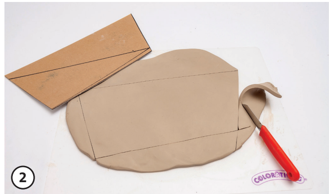
2 Als Schablone ein Modell für die Kräuterschilder aus Fotokarton ausschneiden (ca. 30 x 15 cm).