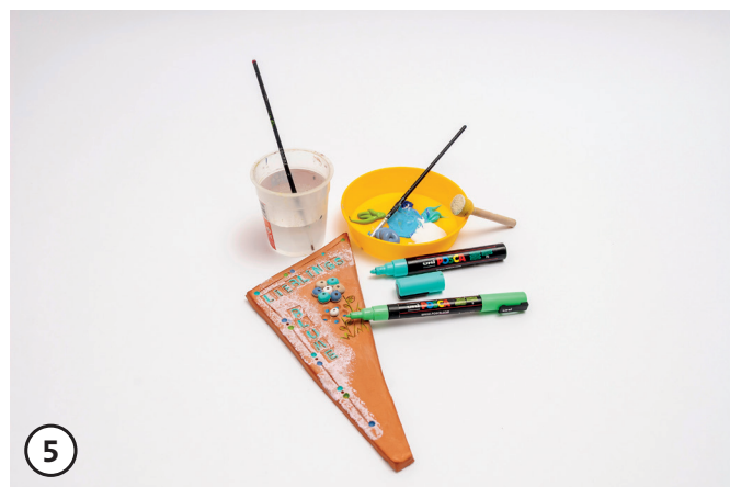
5 Bevor der Schulton zum Brennen in den Brennofen kommt, fertig modelliertes Kräuterschild mit Engoben bemalen und brennen (Schrühbrand). Nach dem Schrühbrand transparente Flüssigglasur auftragen und nochmals brennen. Mit der transparenten Flüssigglasur wird der SchULTON für den Außenbereich geschützt. Beim modellieren mit Softton die fertigen Kräuterschilder ca. 1 – 3 Tage an der Luft trocknen lassen. Danach mit Decorlack oder Posca-Stiften bemalen. Um die Kräuterschilder vor der Witterung zu schützen, diese komplett mit wetterbeständigem Klarlack besprühen.

Viel Spaß bei der Umsetzung wünscht das OPITEC-Kreativteam!